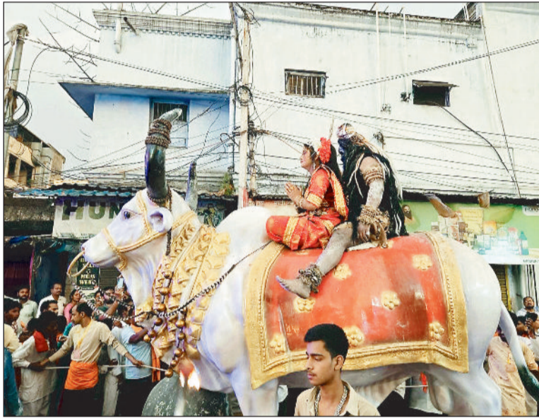
हरिभूमि न्यूज || रायगढ़

नंदी में बैठे पार्वती के साथ भगवाना भोलेनाथ, रथ पर सवार प्रभु श्रीराम-जानकी और हनुमान। यह झांकी बरबस ही लोगों का ध्यान आकर्षित कर रहा था। कटप्पा, आदिवासी नृत्य, सुआ नृत्य और तलवारबाजी ने रोमांच बढ़ा दिया। यह सब मनोहारी दृश्य रामनवमी के अवसर पर शुक्रवार की देर शाम शहर में निकली शोभायात्रा के दौरान देखने को मिला। इस दौरान कोने-कोने तक जय श्रीराम का नारा गुंजित होता रहा। शहर के हर चौक-चौराहों से गुजर रहे शोभायात्रा का लोगों ने स्वागत किया। करीब 60 समाज की अलग-अलग झांकियां मन को आनंदित कर रहे थे। शोभायात्रा के दौरान पूरा शहर राममय हो गया। कई तरह की झांकियां, अलग-अलग और आकर्षक परिधानों में सजे छोटे और युवाओं की टोली भी आकर्षक का केंद्र रहा। हर मोहल्ले से अलग-अलग समूहों में झांकियां निकाली गईं। पंजाब का पाइप बैंड और दिगर जिलों से आए डीजे वालों की लाइटिंग ने लोगों का मन मोह लिया। कुल मिलाकर शहर में निकाली गई शोभायात्रा की मनोहारी दृश्य लोगों को मोहित कर रहा था।